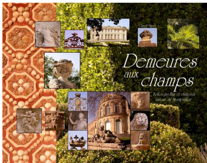
Couverture de « Demeures aux champs »

C'est un imagier, voulu le plus complet possible, et peut-être, pour qui le feuillette, un point de départ pour (re)découvrir ce patrimoine, ainsi qu'une contribution modeste à sa connaissance par l'information synthétique qui accompagne les photos.