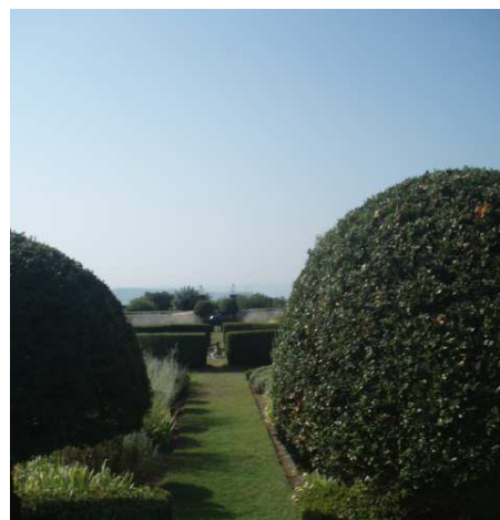
Le Pavillon de Galon