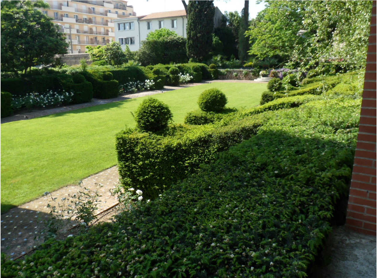
Vue du jardin vers l'ouest et les ifs taillés. Vue du jardin vers l'est et la pergola