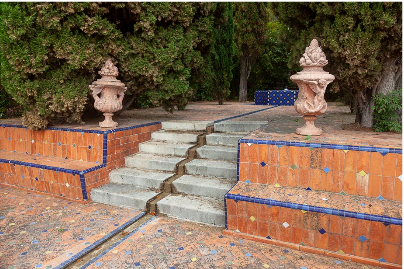
Escalier de transition. Bancs et vases. Villa Guy. Cl. N. Desagher. 2021

La fontaine aux 2 vasques Villa Guy 2015 CI AAC JPG