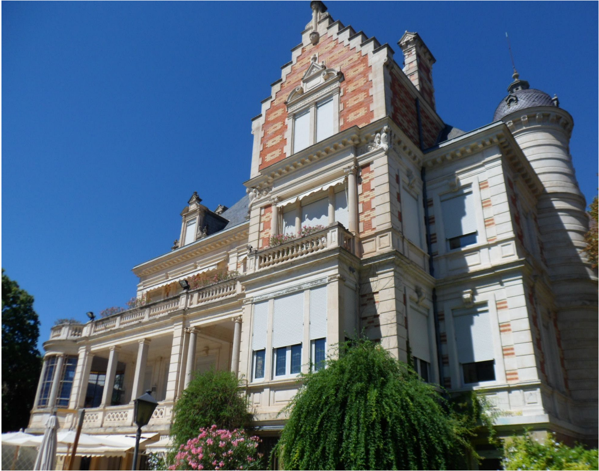
Villa Guy. Façade sud après réhabilitation. 2015