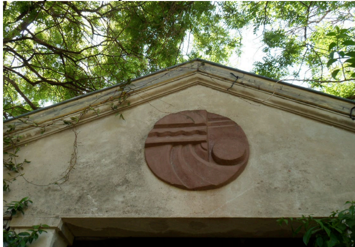
SAM 0491 JPG Fronton du pavillon du jardinier.